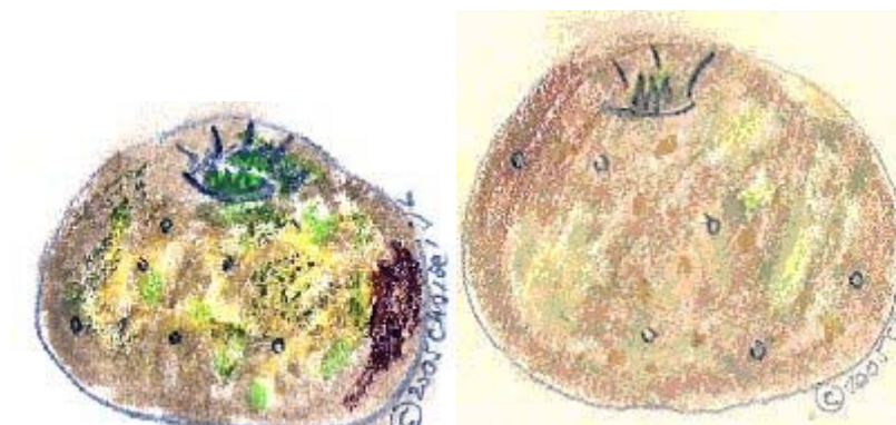
Pastel Jean-Louis Choisel © 2005

Fichier Choisel jean-louis-©2005-2006-2008